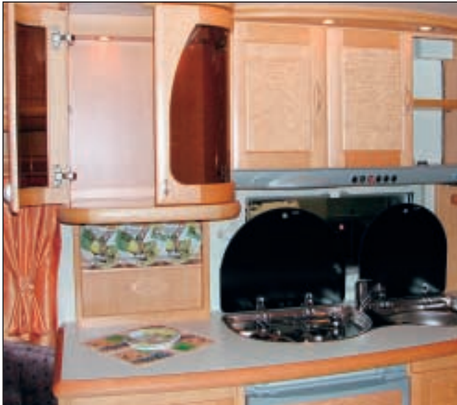
Stor kjøkkenbenk med fine hyller og skap. Vitrineskapet mellom sittegruppe og kjøkken er et av Hobbys kjennetegn.