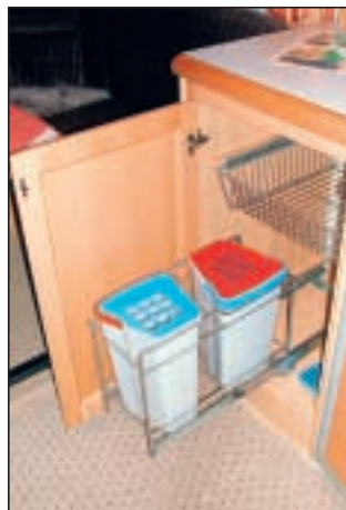
I kjøkkenbenken er det spenn for avfalls-sortering.

Varmen får du fra et Truma luftvarmeanlegg, om du ikke vil legge til ca kr 17000 og få en vogn med Alde vannvarme. I Truma-anlegget kan du få et Ultra-Heat 2000 watts varmeelement for kr 3200, og du kan også be-