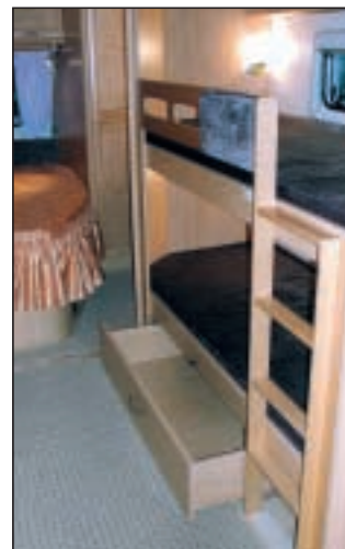
Køyesengene med den fine oppbevaringskuffen under.

stille vognen med elektrisk gulvvarme til kr 7000. Etter hva vi kunne se er det få uttak for varmluft, men dette er noe som må prøves i praktisk bruk før det kan bedømmes.