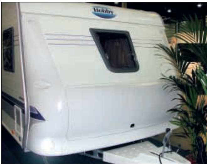
Hobby 720 UKFe har integrert gasskasse.

I denne vogna er mikrobølgeovn standard, men om du vil kan du bytte til stekeovn med eller uten grill i stedet. I kjøkkenbenken er det plassert et par beholdere for kildesortering av søppel og benken har en praktisk uttrekksdel for kjeler og lignende. Konsoll med brytere og vannmåler finner du i panelet over kjøkkenbenken.