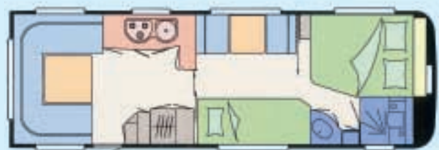
Planskisse for Hobby 720 UKFe.