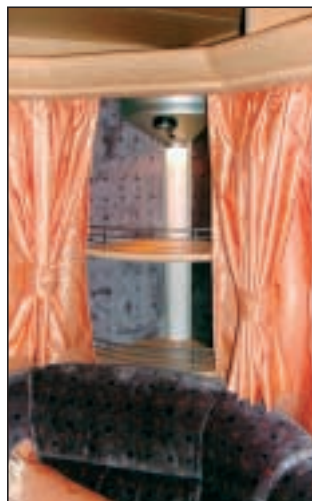
Også hjørnehyllene i sittegruppen har en fin belysning.