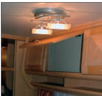
Denne fine lampen over midtsitteren risikerer å bli ødelagt ved røff bruk av skapdørene.

Som konklusjon kan sies at vi forstår hvorfor Hobby er bestselger, for her har du alt du normalt trenger, og det ser også meget bra ut. Hobby har i alle år solgt på utseendet, og en så populær vogn må naturligvis finne seg i å bli utskjelt av mange. Ser en nøye på utførelse og materialvalg er det lett å være kritisk, men for de fleste er det meste godt nok, samtidig som Hobby holder fornuftige priser. □