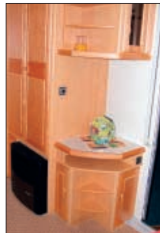
TV-skabet har en fin hylle til VHS-, DVD-spiller eller lignende