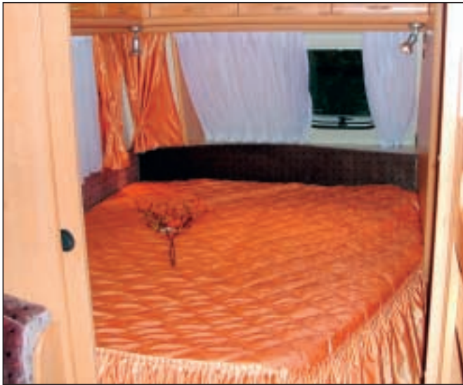
Det er lite å utsette på komforten i dobbeltsengen.