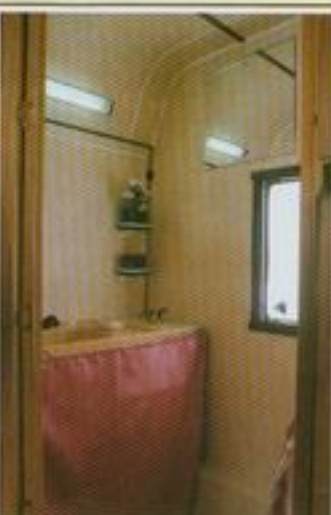
500 S – Specialkonstruerad för barnfamiljen.