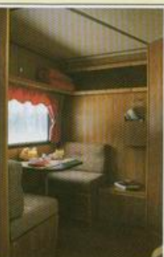
500 T – Det nya alternati- vet bland svenska husvagnar.