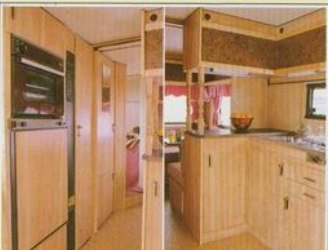
562 GL – Boggien med den berömda planlösningen.