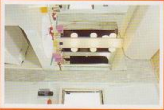
Vergessen Sie die übliche „Mittelzeile“, hinein ins Traveler- Badevergnügen.