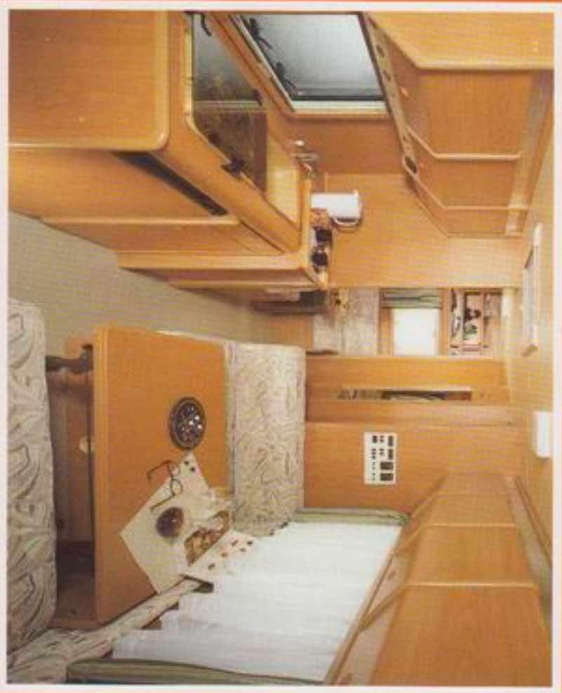
Aus einem ganz besonderen Holz geschnitzt. Sie können selbstverständlich alle Traveler- Modelle auch, wie hier, mit Kirschbaum-Ausstattung bekommen.