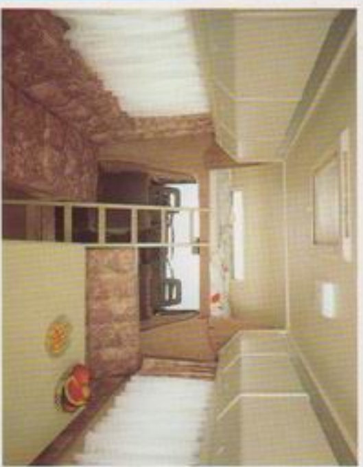
Hier sehen Sie das Schlafzimmer im Traveler 025. Erstens den Alkoven. Abends Couch umklappen, Tisch verschieben – fertig sind 5 Schlafplätze.

Und damit der Spaß am Wohnmobil auch lange hält, haben wir den Traveler sehr solide und aufwendig produziert und verarbeitet. Mit dicken erstklassigen Aluminiumblechen, die eine gute Stabilität geben und mit aufwendigen Karosserieteilen aus GFK für beste Isolationswerte. Gute Aerodynamik verbunden mit guten Fahreigenschaften und sehr günstigen Verbrauchswerten sind beim Traveler fast schon Selbstverständlichkeit.