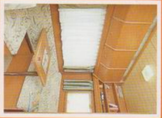
Kinder erwünscht! Der Traveler 625 TK hat sogar einen Bereich für Ihre Kleinen.