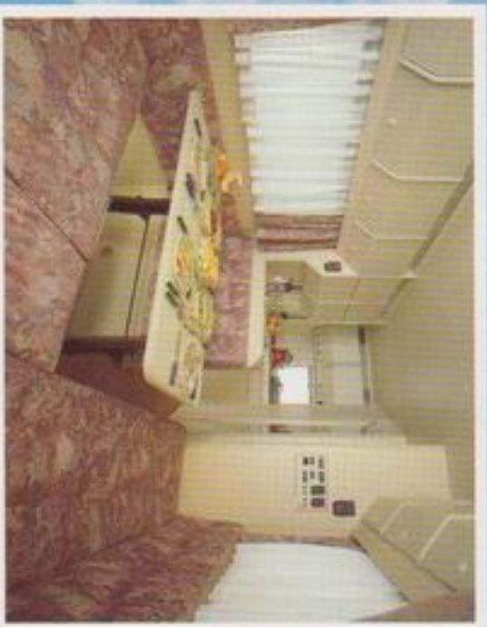
„Dinner for five“, ohne die Ellenbogen in der Suppe des Nachbarn zu baden.