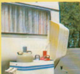
Der abschließbare Deichselkasten, Platz für 2 Gasflaschen und einen Wasserkanister.