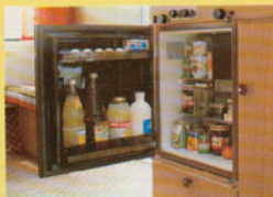
Seriennmäßig eingebaut ist der Elektrolux 2-Sterne-Kühlschrank mit Frostfach, der mit 220 V, 12 V oder Propangas betrieben werden kann.