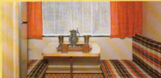
Die kleinere Sitzgruppe der Mustang-Modelle. Auch hier geräumige Wohnlichkeit mit unverkennbarem Geschmack.