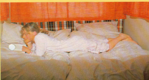
Mit wenigen Handgriffen sind die Sitzgruppen der Mustangs in bequeme Liegeflächen umgebaut. Das Bettzeug kann dabei aus den unter den Sitzen liegenden Staukästen leicht entnommen werden.