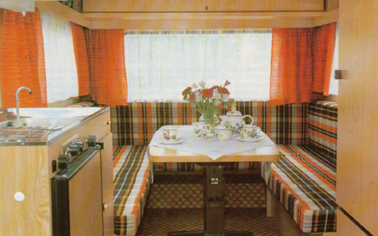
Die große Rundsitzgruppe im Mustang 475 TU. Wie bei allen Mustang-Modellen sind alle Einrichtungen und Details bei gewohnter Knaus Qualität harmonisch aufeinander abgestimmt. Die hochwertigen Sitz- und Liegepolster sind mit geschmackvollen, strapazierbaren Bezügen versehen.