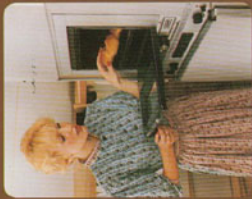
2-Flammiger, zündgesicherter Gasherd und Gasbackofen mit Grill. 12-V-Dur斯拉bzugs- haube.

Die 12-V Eigenversorgung durch Batterie, gekoppelt mit automatischem Ladegerät macht den improvisierten Aufenthalt abseits des Weges zum komfortablen Wochenenderlebnis.