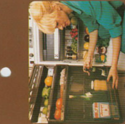
110-ltr. Kühlschrank, Gas-12V-220V, mit Gefrierfach.