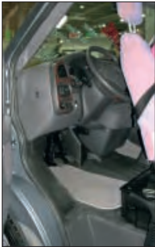
Et gløtt inn på førersiden...

salongbordet. Denne gruppen kan gjøres om til liggeplass for to små. Om du bruker den ekstra klaffen på bordet blir det meget trangt mot klesskapet på motsatt side.