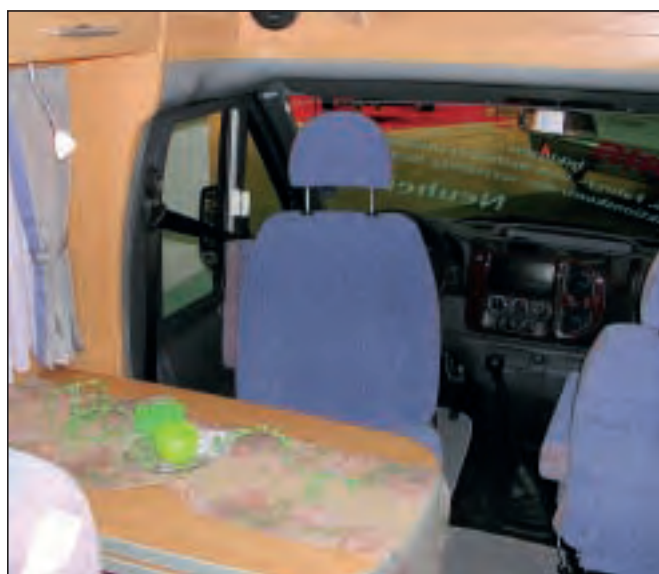
Salongbordet er festet i vegg.

en benkedør. Skuffen mangle innsats for bestikk, men det er like greit så kan enhver innrede etter eget behov.