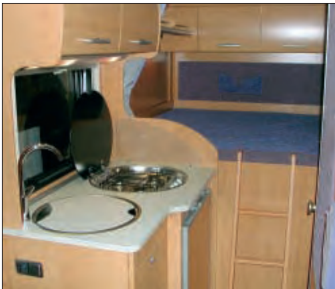
Kompakt skal det være: Den vesle kjøkkenbenken med kokebluss, utslagsvask og kjøleskap, og i bakgrunnen stigen opp til dobbeltsengen.