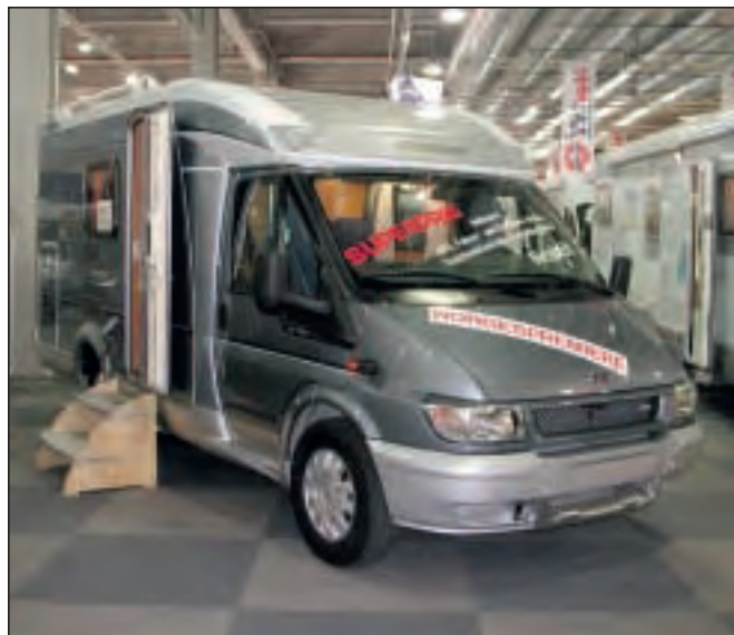
Sølv-versjonen av Hymer Van, som også leveres i rød og blått.

Kjøkkenbenken rett innefor døren er en snau meter bred, og plassen er brukt til et rundt kokebluss og en oppvaskkum. I benken er det lille kjøleskapet plassert side om side med en skuff og