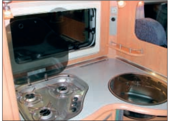
Også kjøkkenbenk og overskap preges av godt håndverksarbeid, med en fin krydderhylle i hjørnet.

Toalettrom og et høyt kjøleskap er midtplassert på ene siden, og klesskap samt vinkelkjøkken på den andre. Foran kjøkkenbenken er det en toseter bak bordet, og