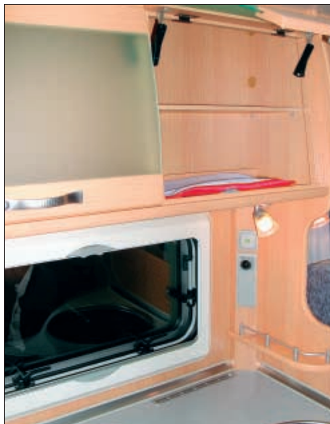
Elegant: Overskapene ved kjøkkenbenken har grønne glassfronter.

Toalettrommet er ganske romslig og har en grei dusj, men vasken er av typen