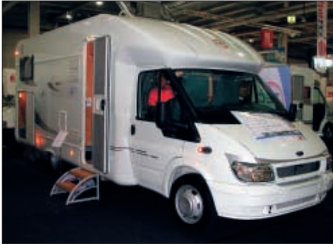
FreeTec 708 Ti – mange fine detaljer.