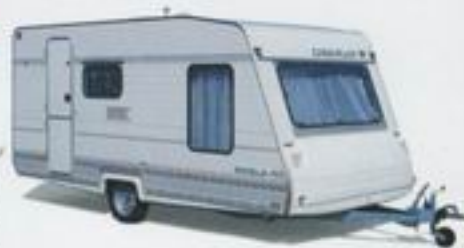
Caravelair-Brasilia: Wohnwagen für die ganze Familie. Komplett urlaubsklar!

Die bewährte Baureihe mit Reise- und Dauercamping-Caravans von 3,60 bis 5,70 m Aufbauhöhe. Interessante, familienfreundliche Grundrisse, geschmackvolle Möbel in warmen Holztönen, Polster und Gardinen farblich abgestimmt.