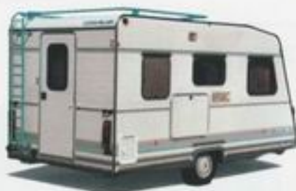
Caravelair Mobile Car: der total andere Wohnwagen!

Manche Wohnwagen sind ein bißchen anders als andere. Das Caravelair Mobile Car ist ganz anders! Da stecken so viele Ideen und Neuerungen drin, daß Ihr nächster Urlaub zum ganz besonderen Erlebnis wird.