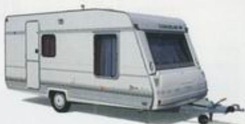
Caravelair Bamba Luxe: Klasse!

fach nur weiß, sondern weiß lasiert. Dadurch scheint das natürliche Holzdekor von unten her durch und bleibt erhalten. Die Tischgestelle und die Heizungs-Verkleidung sind farblich passend abgestimmt und die Luxus-Ausstattung mit Edelstahl 3-Flammenkocher/Spülenskombination und komfortablem Toilettenraum ist natürlich sereinmässig.