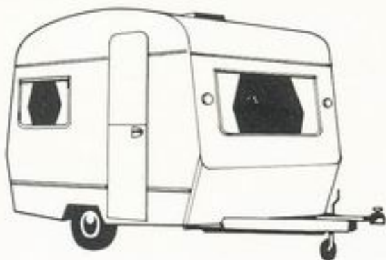
Eccles GT 306 10'