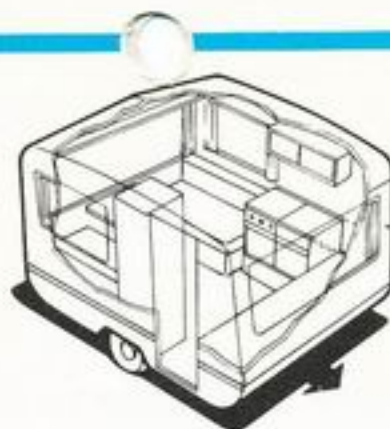
445 kg 4 senger