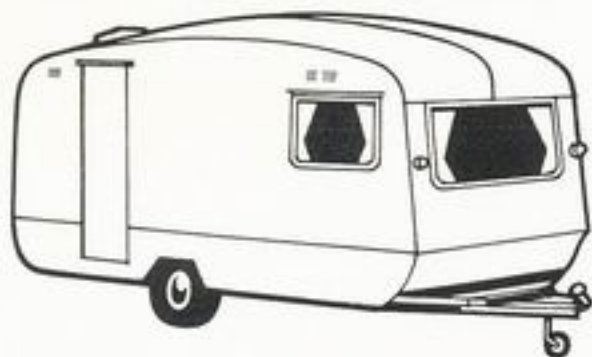
Europa III 16'