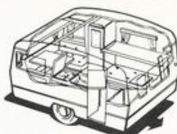
590 kg 4 senger