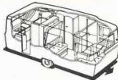
940 kg 6 senger