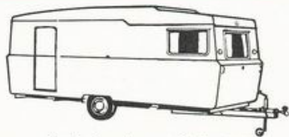
Sprite Countryman Mk II 17,5'