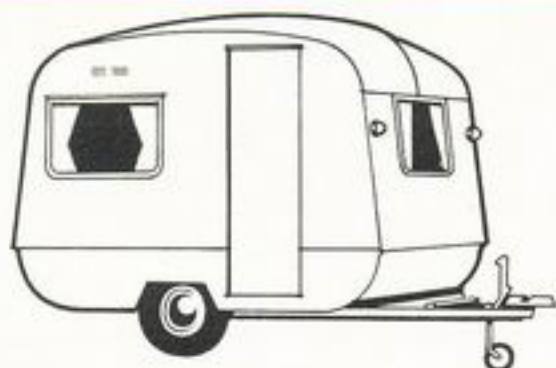
Europa I 9'