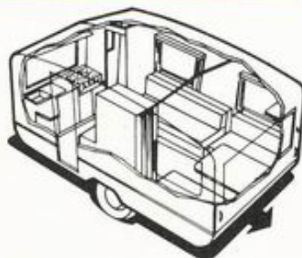
699 kg 4 senger