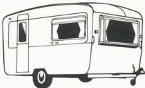
Eccles Moonstone 13'