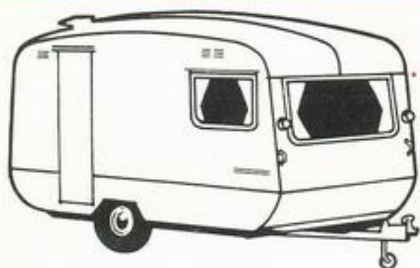
Europa II 13.5'