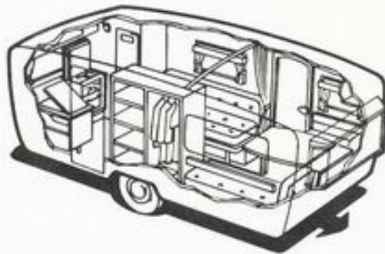
812 kg 4 senger