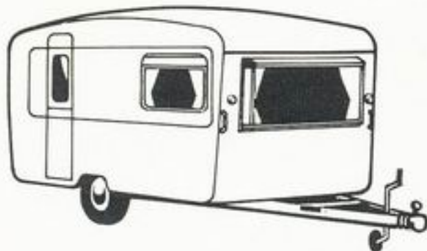
Eccles Sapphire de Luxe 16'