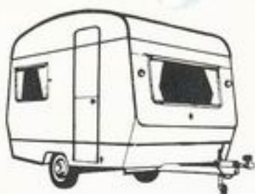
Sprite 400 Mk III 10'