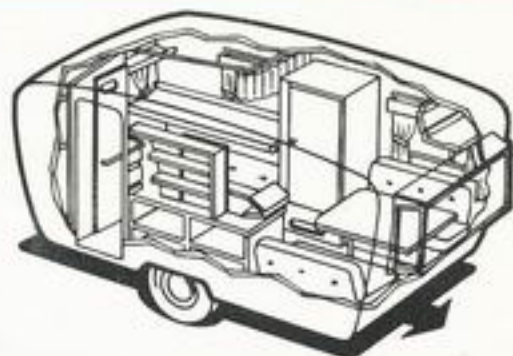
687 kg 4 senger