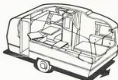
611 kg 5 senger