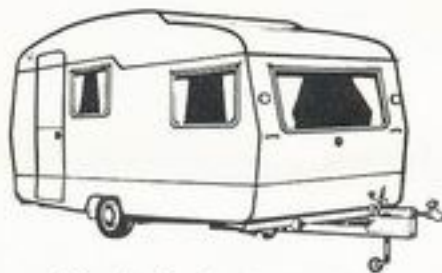
Sprite Musketeer 14'