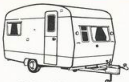
Sprite Alpine 12'