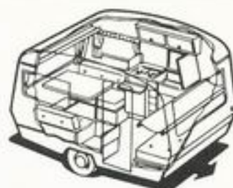
432 kg 4 senger