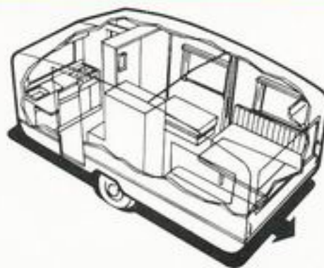
800 kg 4 senger