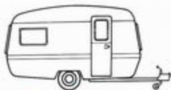
Europe II : 5 places

Longueur de la caisse : 3,10 m Largeur : 1,98 m Poids à vide : 483 kg Prix (départ Rouen) 6 084 F TVA incluse sans immatriculation