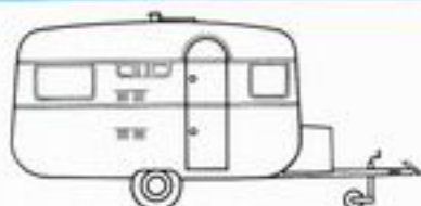
Wilk 375 TQ : 4 places

Longueur de la caisse : 4,50 m Largeur : 1,98 m Poids à vide : 696 kg Prix (départ Rouen) 8 460 F TVA incluse