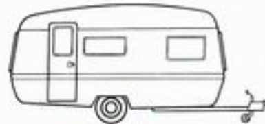
Europe III : 5 places

Longueur de la caisse : 3,85 m Largeur : 1,98 m Poids à vide : 604 kg Prix (départ Rouen) 7 680 F TVA incluse sans immatriculation