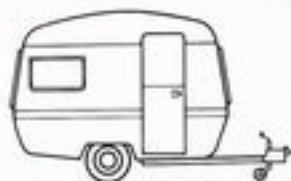
Europe I : 4 places

Longueur de la caisse : 3,10 m Largeur : 1,98 m Poids à vide : 483 kg Prix (départ Rouen) 6 084 F TVA incluse sans immatriculation