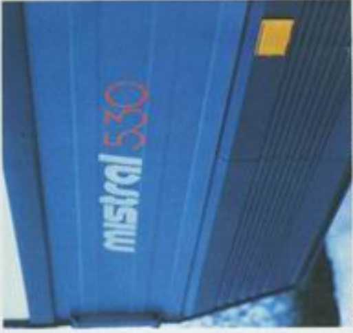
Støtfangeren av kunststoff som beskytter den nedre delen av Mistralens karosseri.