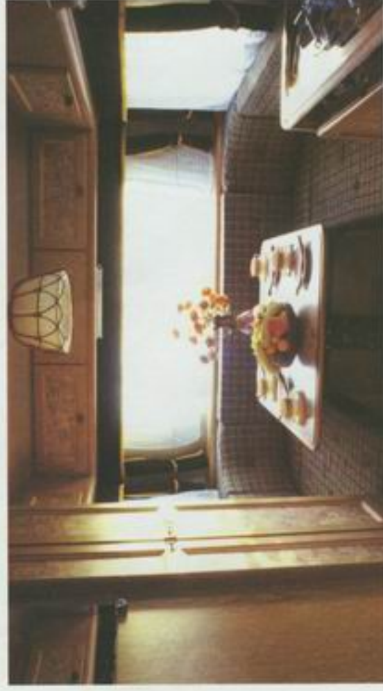
Rundsitttegruppe i hovedsalongen er standard i mange av modellene - her i Scandinaf.