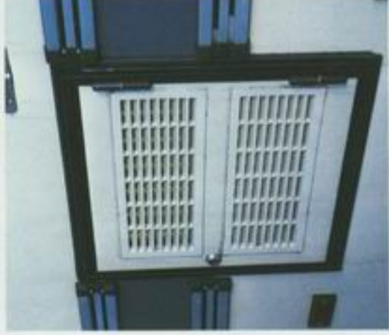
Scandinaf har en praktisk inspeksjons- og reparasjonslukke for kjøleskapet på utsiden av vognen.