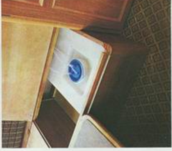
40 l innebygget vanntank er standard i alle modellene - unntatt Comfort.