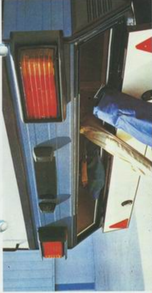
Låsbart bagasjerom i Mistralens bakre del gjør det enkelt å få med seg sportsutstyr, ski etc.