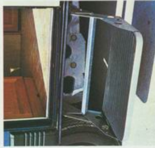
Mistral er utstyrt med nedfellbart sligtrinn.