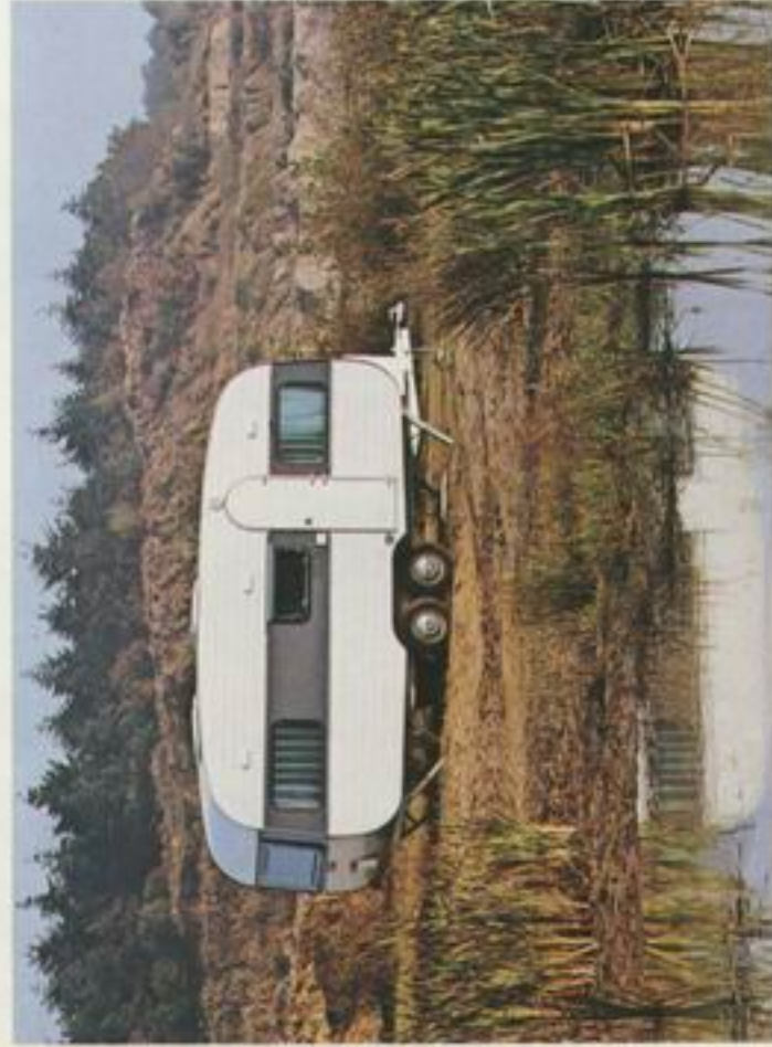
500 de Luxe

Neu in unserem Adria-Programm 76 ist die de Luxe Serie. Die Modelle werden in den Größen 330/380/410/450/500/640/700 gebaut. Neben der serienmäßigen Ausstattung wie bei den Komfort-Modellen mit Doppelverglasung, Heizung, Kühlschrank und Ei. Wasserversorgung gibt es hier noch viele Extras, die das Camping-Freizeitvergnügen angenehm werden lassen. Rückmatic, (bis zum Modell 500) Küchen-Jalousie, rahmenlose Doppelfenster getönt, Kühlschrank, Heizung und in allen Modellen außer 330 SLB und 450 Q Rundumsitzgruppen mit Hubtisch, das sind die Merkmale der de Luxe Serie.