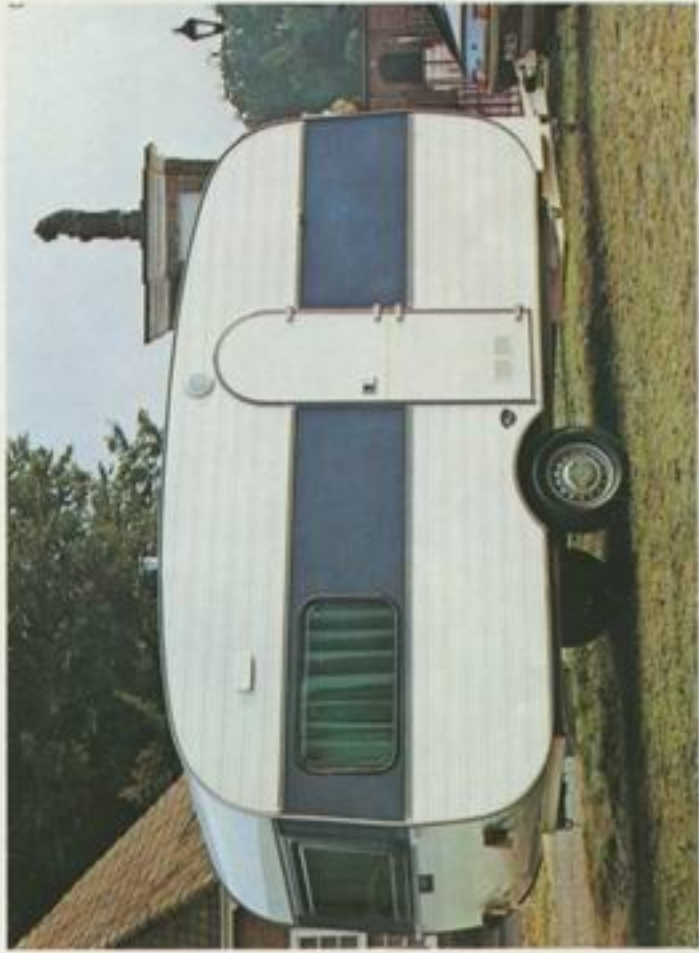
410 Q de Luxe