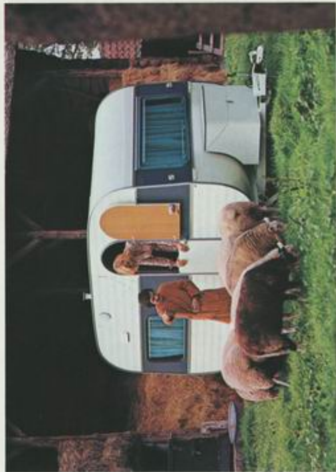
330 SLB de Luxe