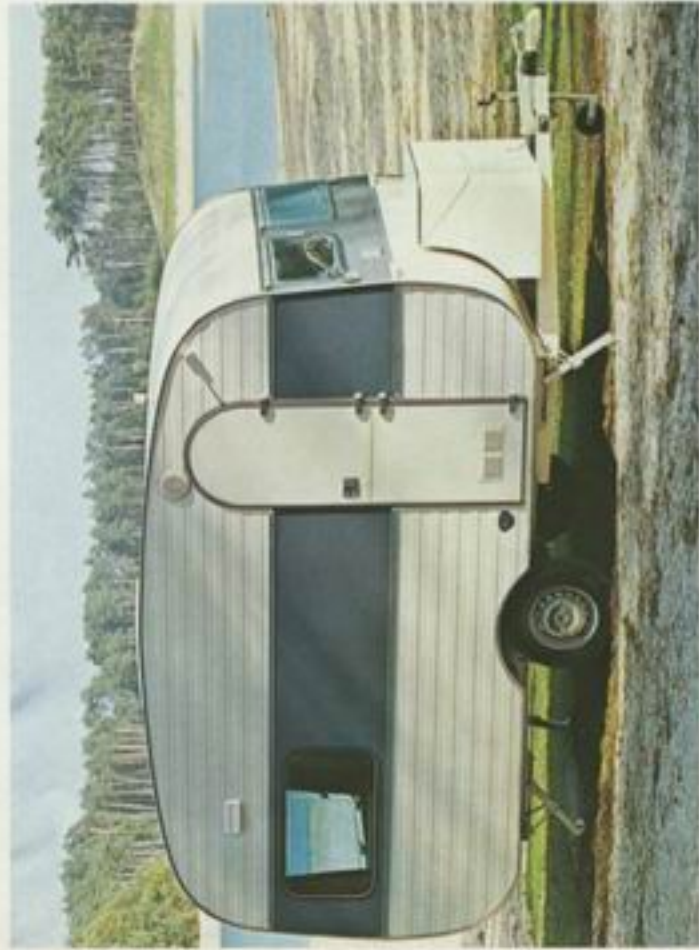
380 TL de Luxe