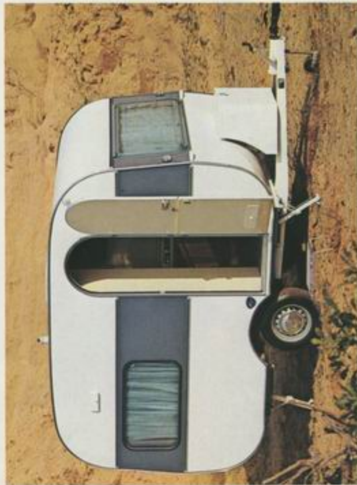
305 SLB Komfort

DIE NEUEN VON ADRIA der Modell-Serien Komfort und de Luxe vereinigen alle Merkmale unserer Tradition. Hochwertige Qualität, handwerkliche Verarbeitung und eine reichhaltige Palette an Modellen zu einem vernünftigen Preis, das ist das BESONDERE bei ADRIA.