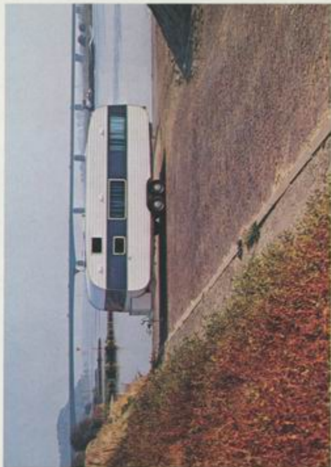
640 de Luxe