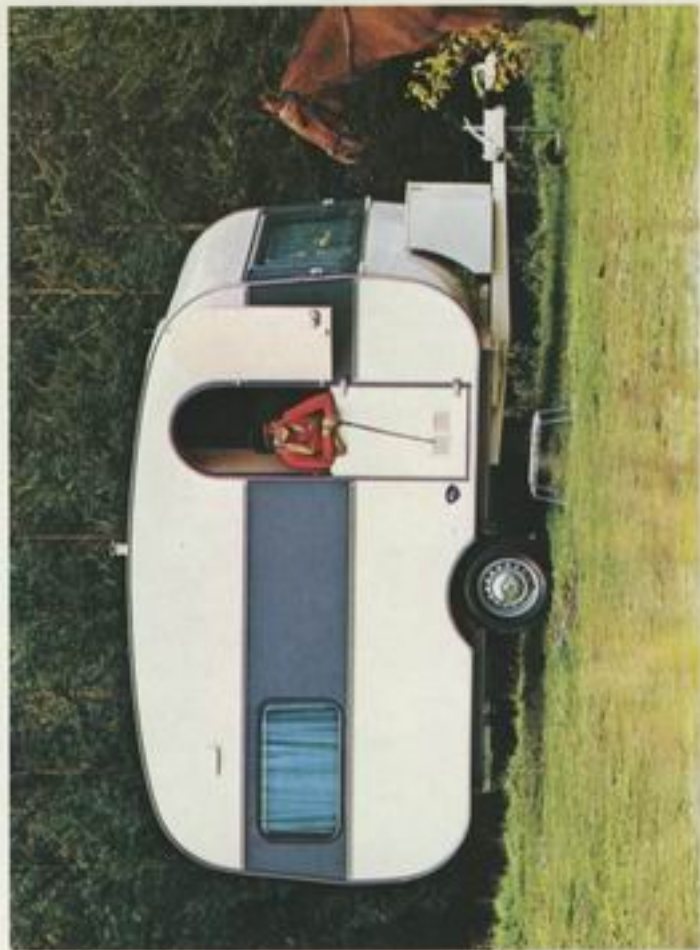
360 L Komfort