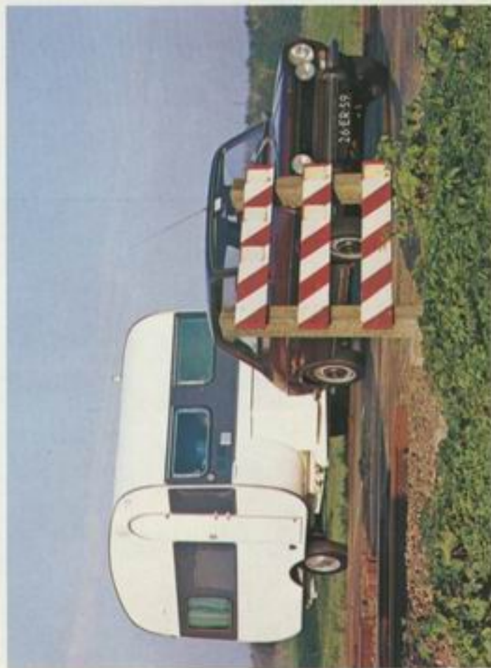
330 T de Luxe