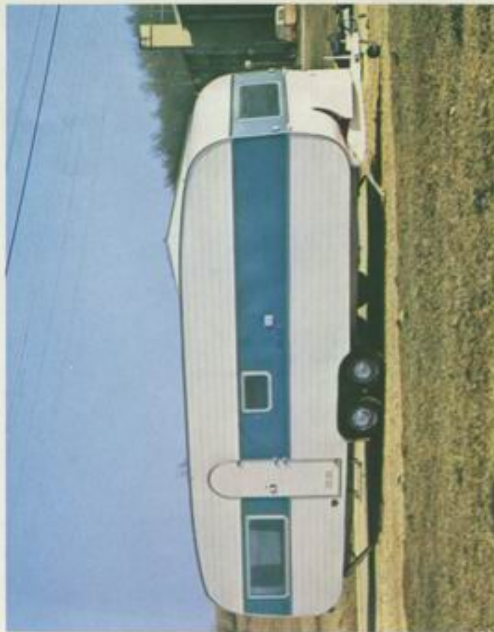
700 de Luxe