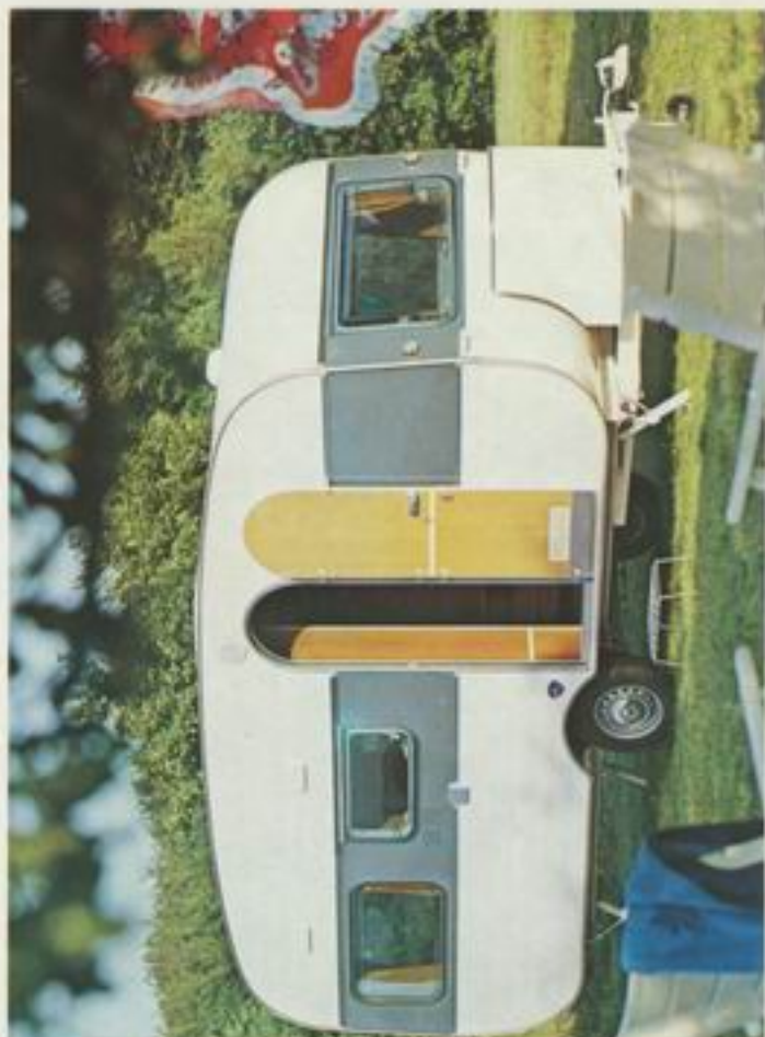
450 O de Luxe

Bei den Modellen 450 und 500 sind die Schlafkombinationen durch eine separate Holzschiebetür abtrennbar. Diese Aufbauanlagen sind vor allem deshalb so begehrt, weil sie sich gleichermaßen für die Dauernutzung als auch für sorgloses Reisen anbieten. Reichlich Stauraum gibt Ihnen die Möglichkeit alles mit in die Freizeit zu nehmen was Sie nicht entbehren möchten. Die ausreichende Beleuchtung aller Teilbereiche kann mit Gas, Netz- und Batteriestrom betrieben werden.