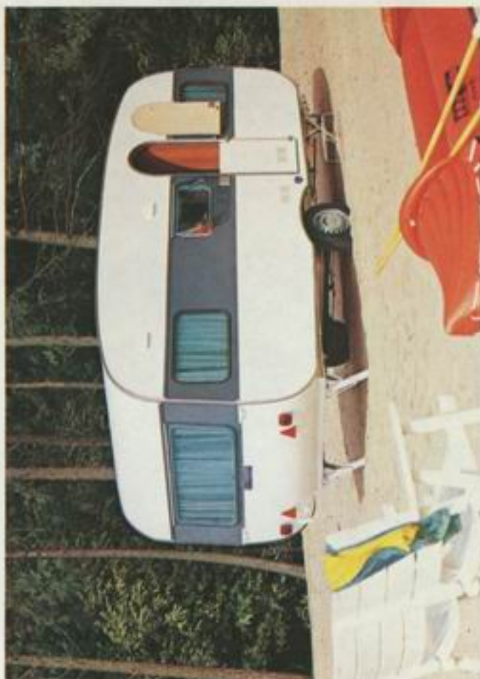
500 E Komfort