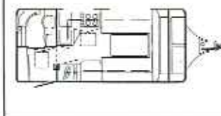
KH 495 TLB-S