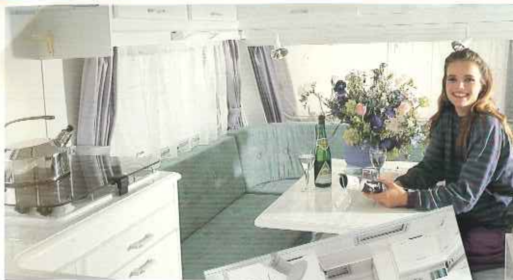
Op de interieurfoto's in deze brochure is de KIP Hy-Line KH 415 TH afgebeeld.