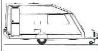
KH 495 TLB-S