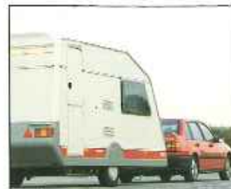
KH 415 TH