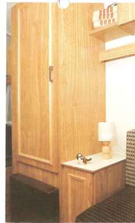
royale hangkast (C 380)