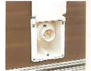
goedgekeurde 220 volt buitenstopkontaktkast NEN 1010