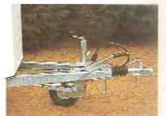
extra lange dissel voor betere gewichtverdeling en wegligging