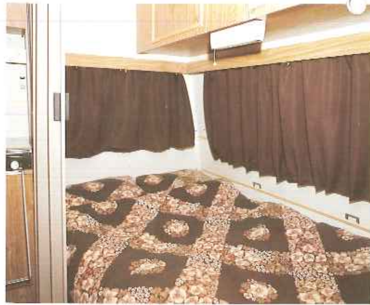
tweepersoonsbed, hoofdeinde breder dan voeteneinde, i.v.m. separatiwand