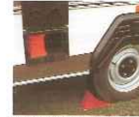
wielkeggen opgeborgen in een ingebouwd kastje (bij C 380 en C 440)