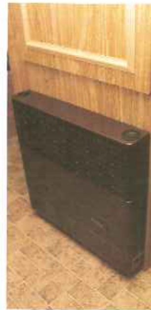
beveiligde Truma kachel