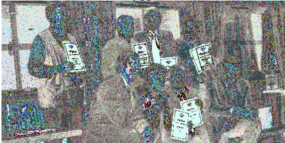
Fornøyde ferdighetskjørere med sine diplomer og merker