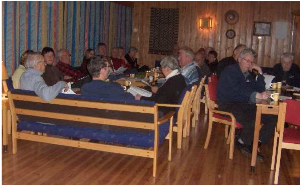
Fra årsmøtet 2006 på Kirkeby grendehus i Eidsberg

Årsmøtedokumentene skal være klare senest 14 dager før årsmøtet. Dokumentene blir lagt ut på vår internettside - www.nocc.no/129 - etter hvert som de blir klare. De kan også fåes ved å kontakte sekretæren på tlf 928 50 572 eller på epost til avd129@norskaravanclub.no .