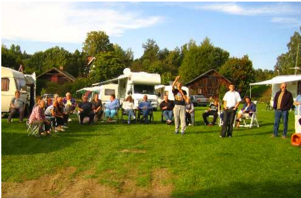
Fra høsttreffet på Sløvika Camping ved Jevnaker