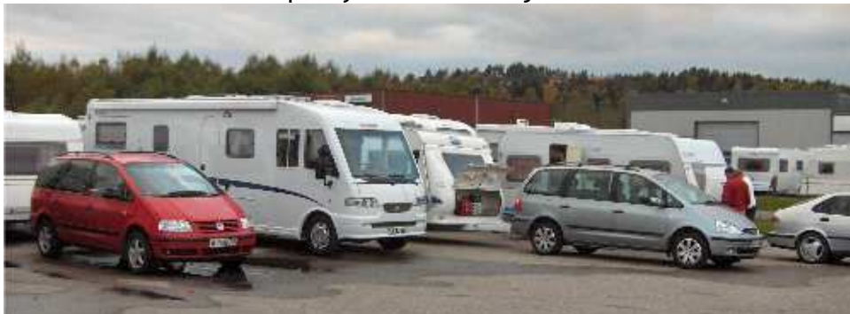
I år ble 30 vogner og bobiler kontrollert, men hvorfor kom ikke du?