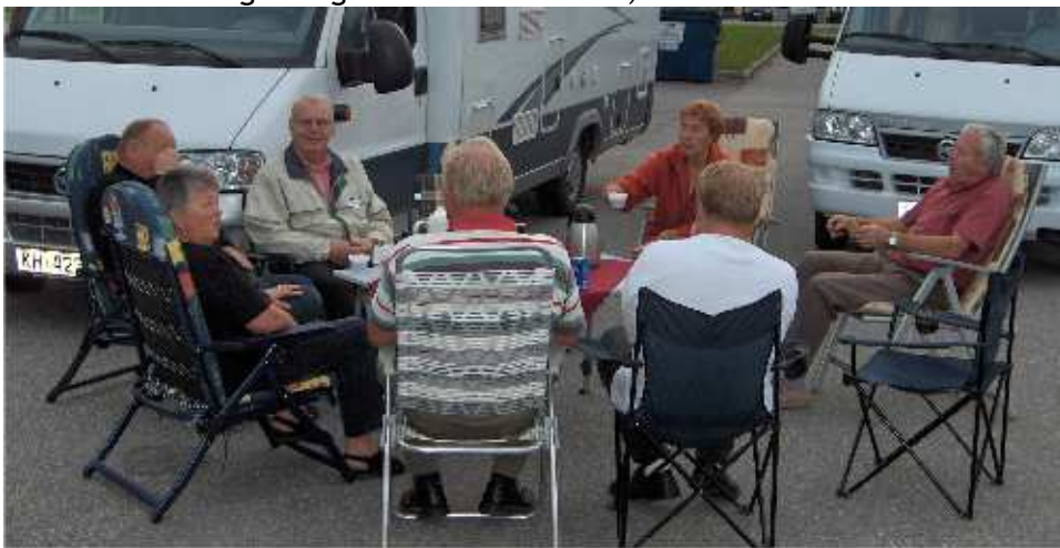
Kaffekos og skravling hører også med! Her fra merkekjøringen for bobiler