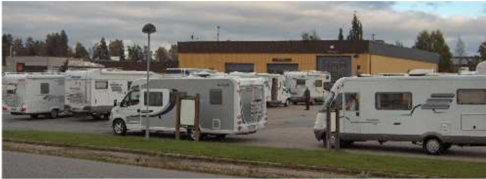
Det var stor trafikk på Mysen trafikkstasjon under teknisk kontroll