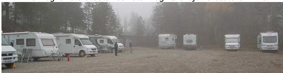
Høstlig stemning på søndag morgen. 14 overnattet i bobil/vogn.