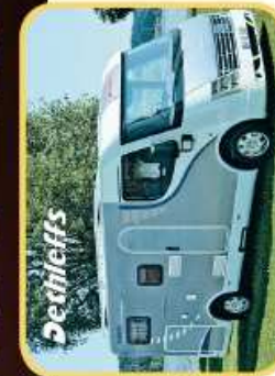
— OPPLEVELSER UNDERVEIS