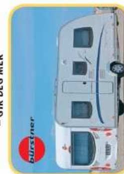
— SUKSES SVOGNEN