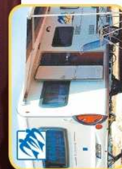
— GIR DEG MER